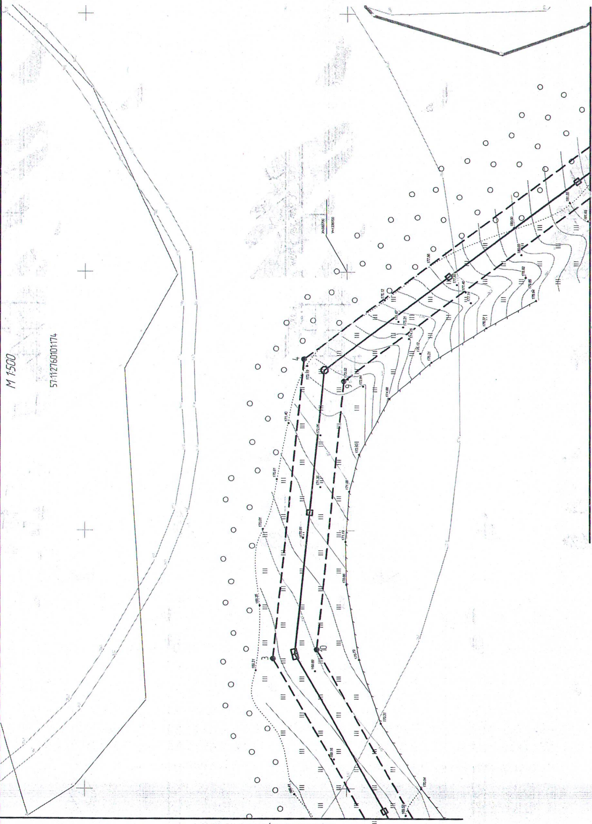
Линия соещения с листом 1